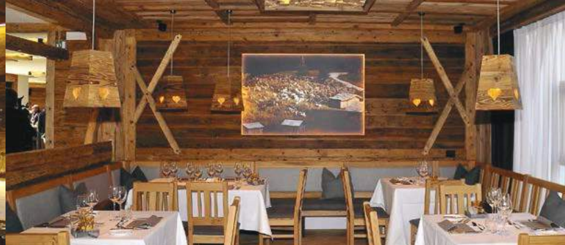
Presso l'Alpine Hotel Gran Fodà, l'eccellenza e il design sposano le tradizioni locali.